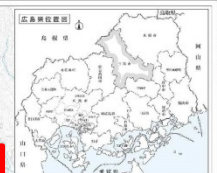
広島県北部建設事務所管内図