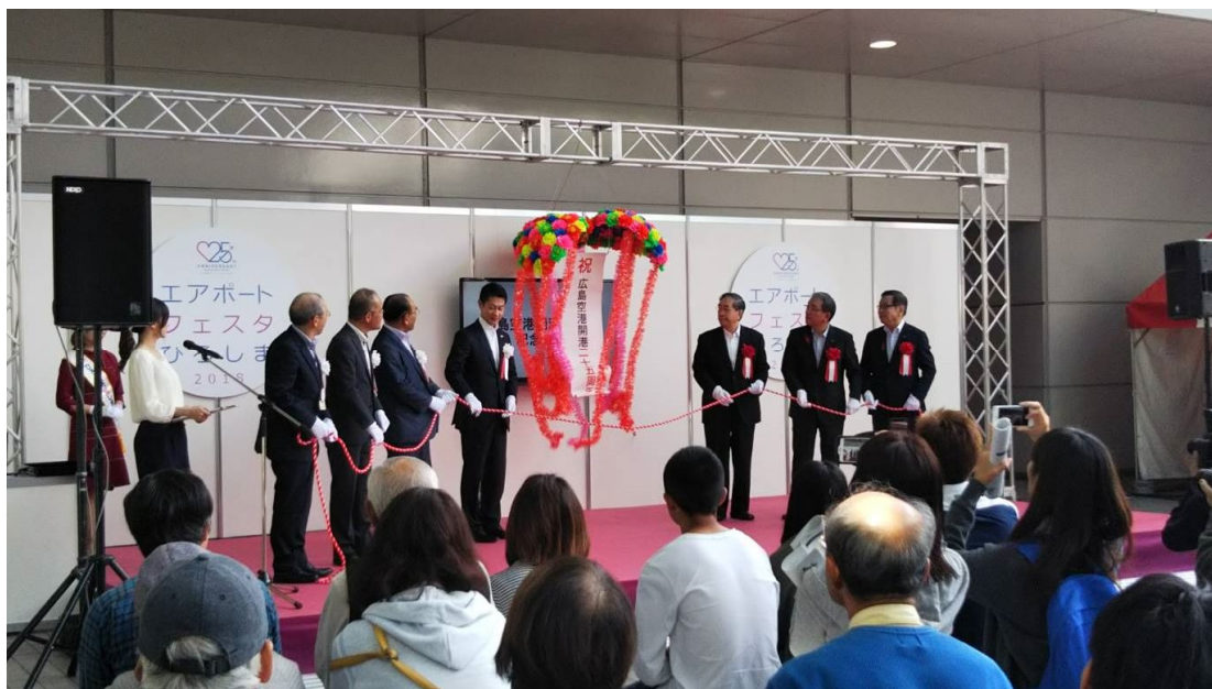
広島空港開港 25 周年記念式典