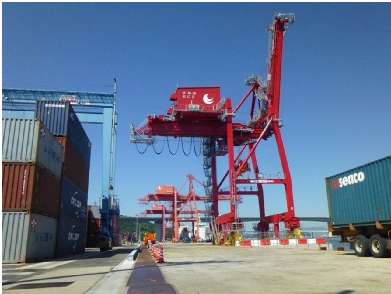
広島港海田コンテナターミナル（ガントリークレーン3号機 H30.6供用開始）