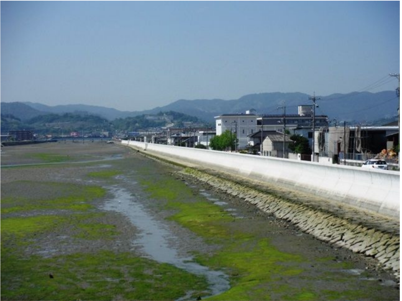
港湾海岸保全施設整備事業 尾道糸崎港海岸機織地区（福山市）