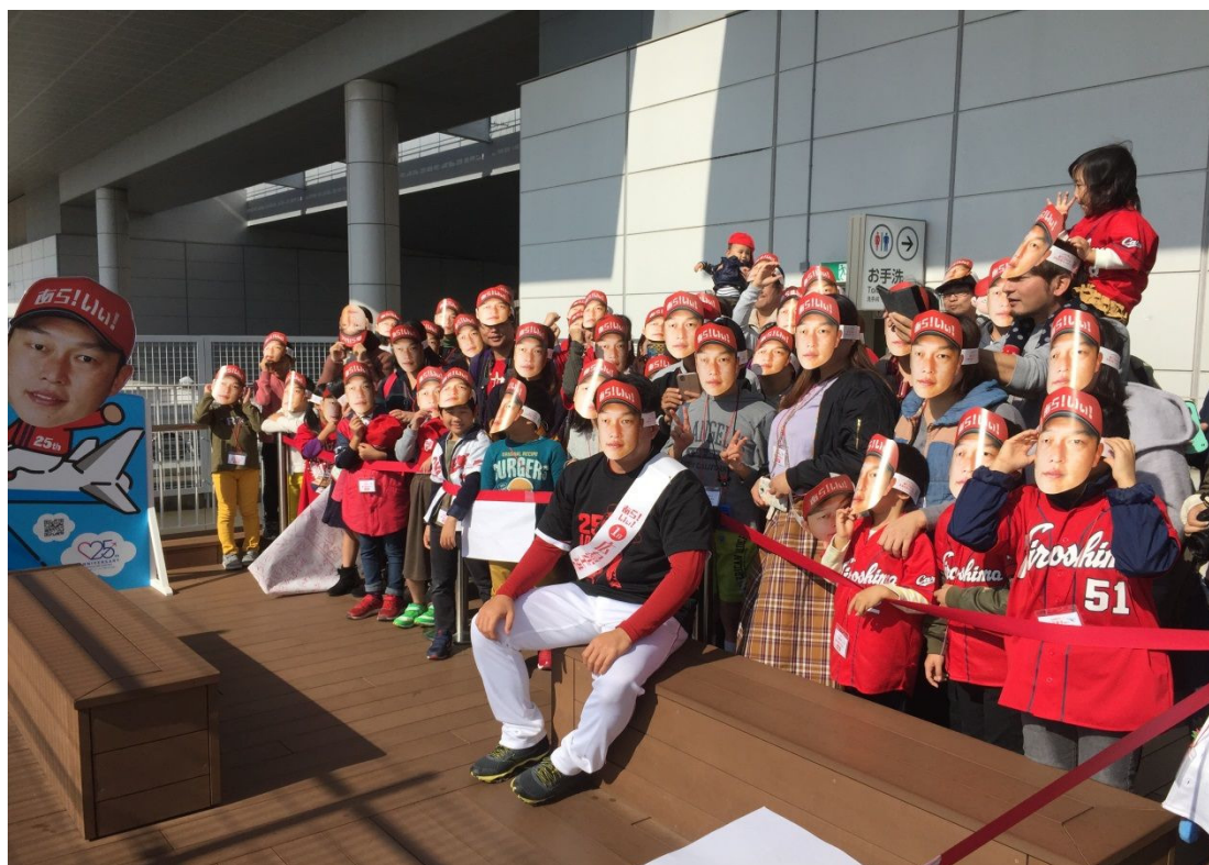
カープ選手の1日空港長イベント