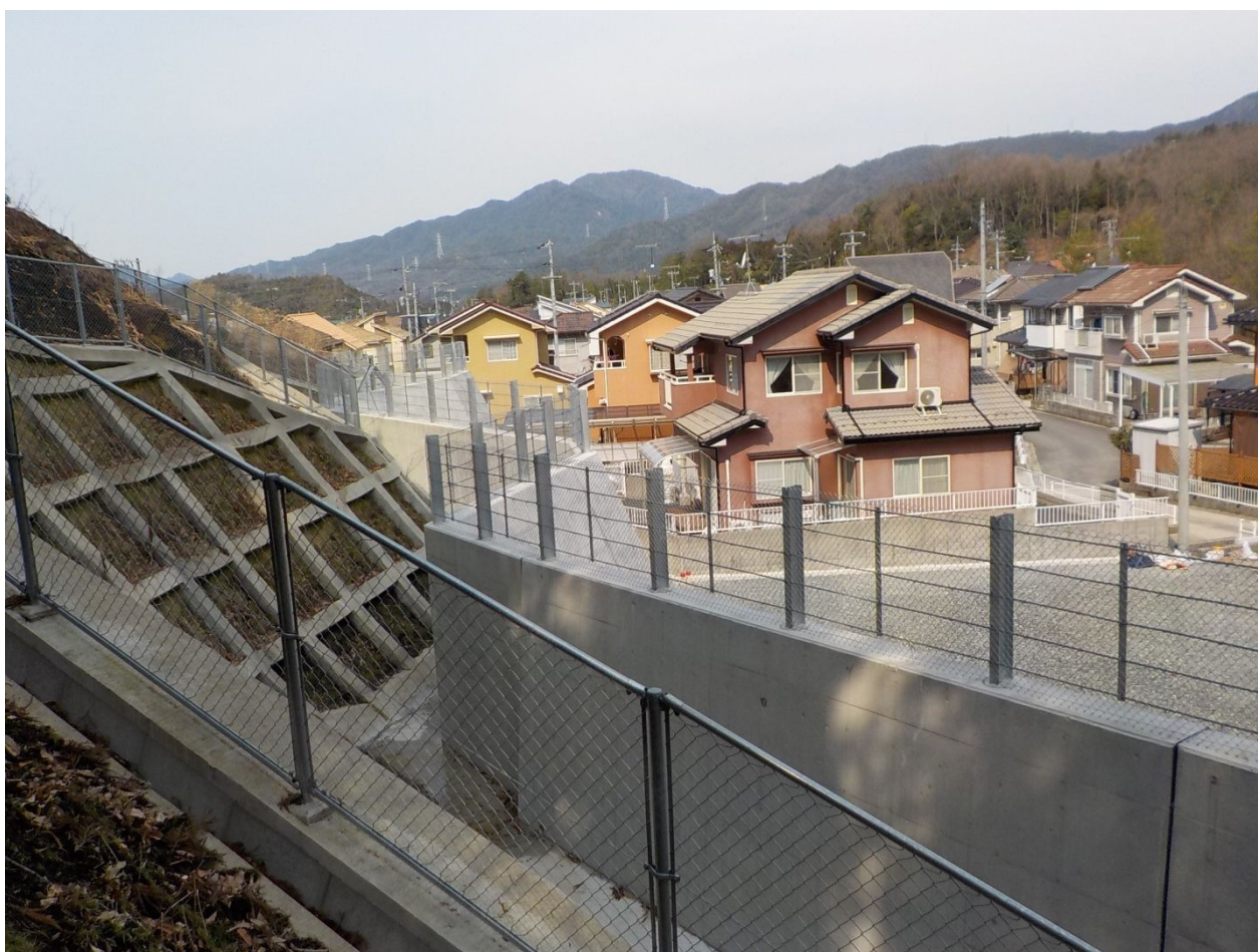
急傾斜地崩壊対策事業（広島市安佐北区）