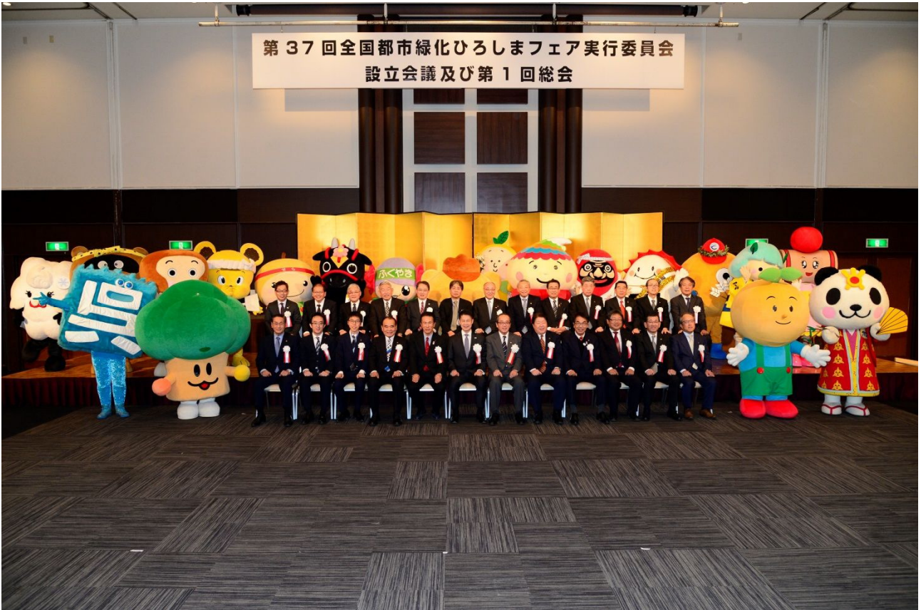
第37回全国都市緑化ひろしまフェア実行委員会設立