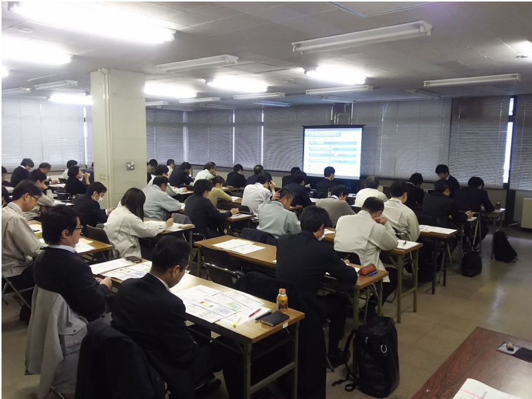
被災建築物応急危険度判定コーディネーター講習会の様子