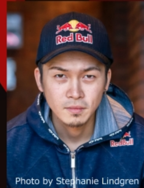
ガチくん プロeスポーツ プレイヤー