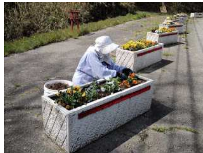
【沿道植栽】三次庄原線