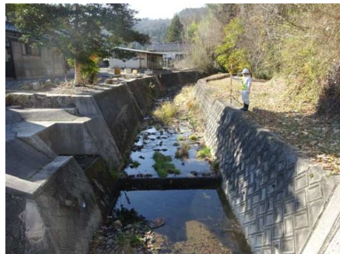
河川堤防 点検状況