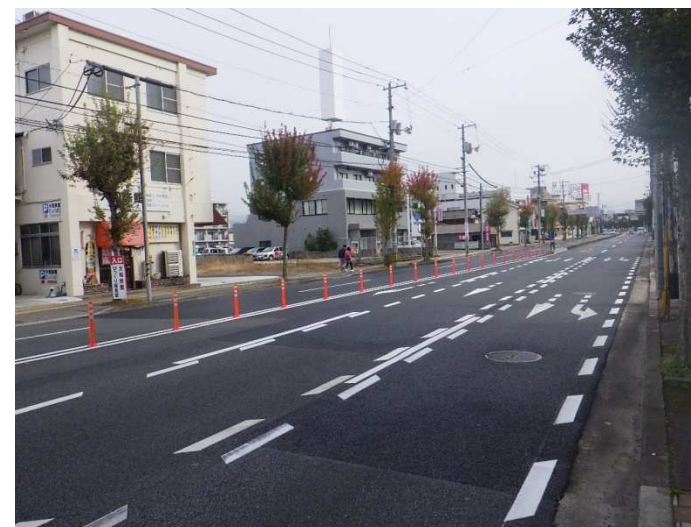
道路 舗装補修状況