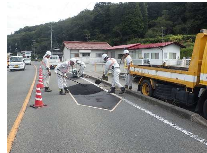
道路 ポットホール修繕状況