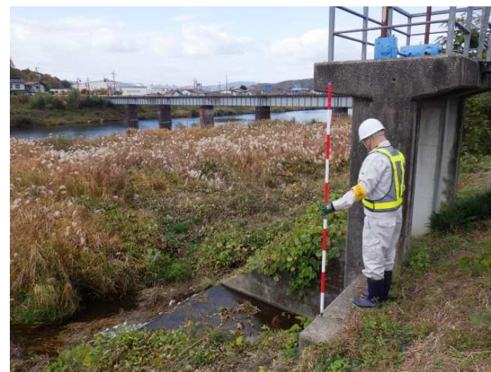
河川樋門 点検状況