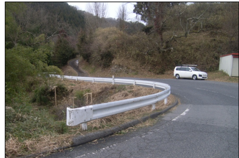
【道路再生改良】三次大和線 令和元年度 用地買収