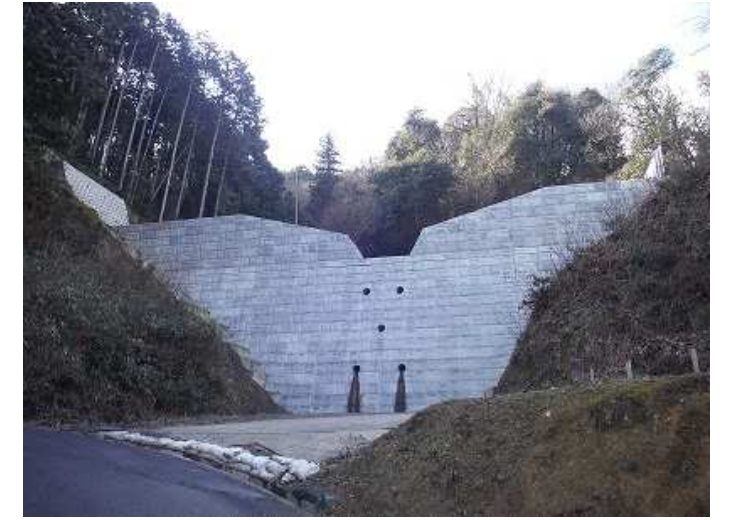
【砂防】中ノ村川4号(粟屋町・1基目) 令和元年度工事 堰堤工