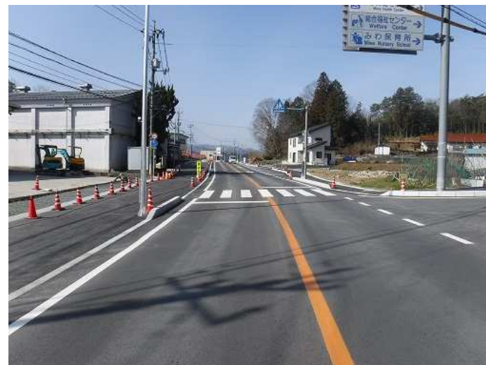
【歩道整備】世羅甲田線(三和町) 令和元年度工事 [完成]