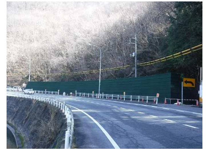
【道路防災】国道375号(有原町) 令和元年度工事 落石防護壁工