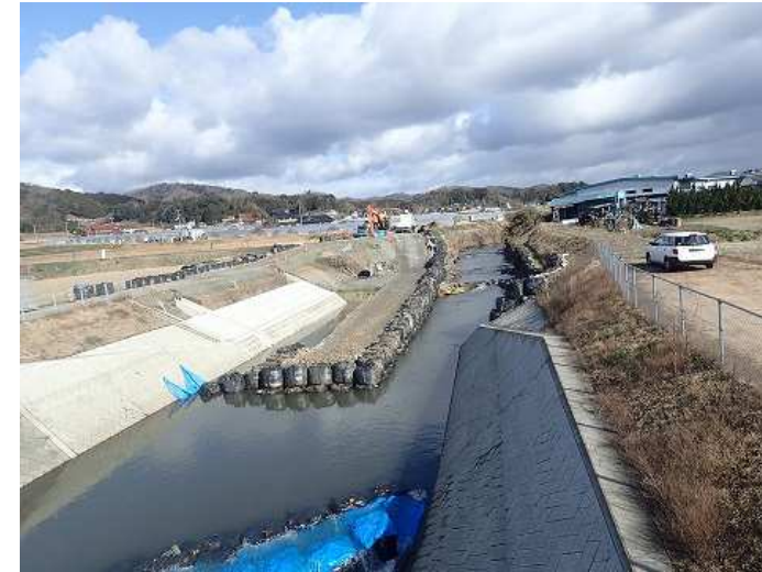
【河川改修】国兼川(和知町) 令和元年度工事 護岸工