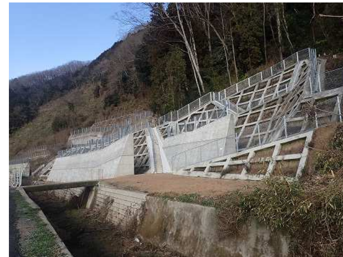
【急傾斜】畠敷地区(畠敷町) 令和元年度工事 待受擁壁工・法枠工