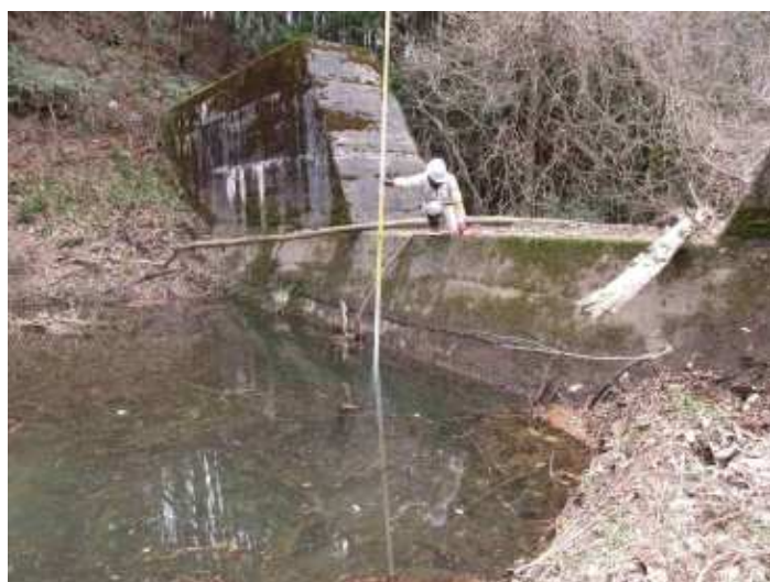
砂防堰堤 点検状況