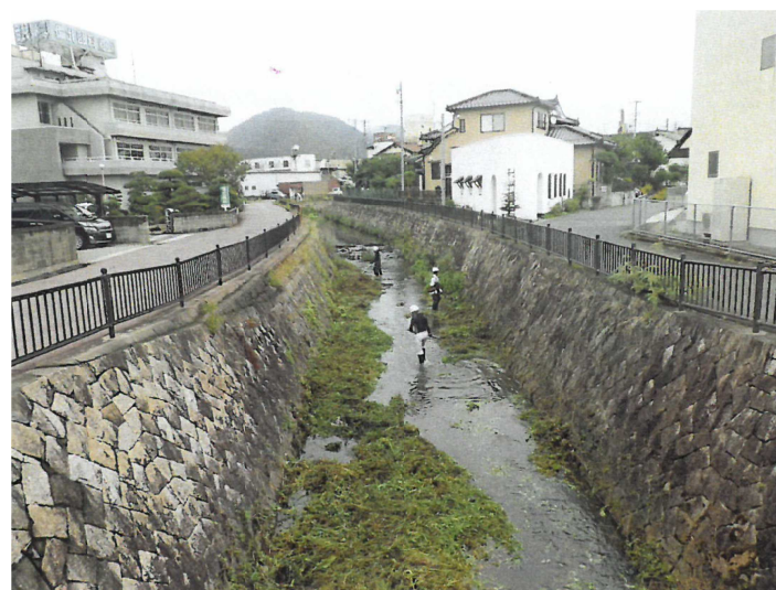
河川のボランティア美化活動