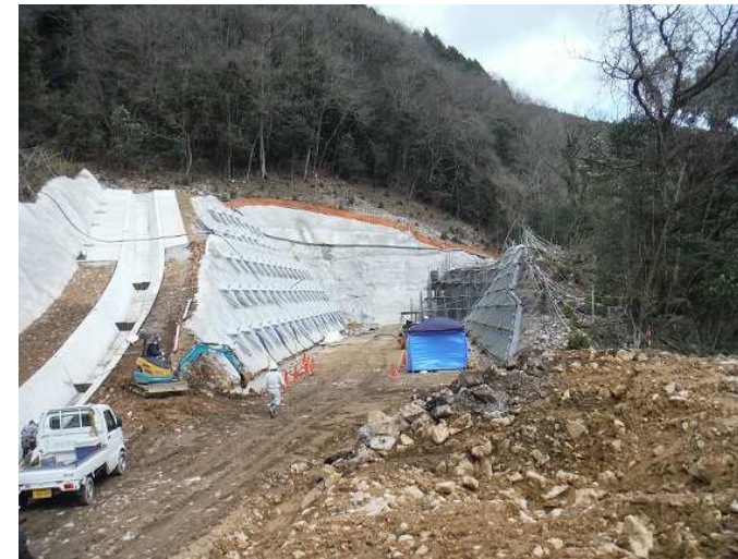
【道路改良】国道375号(日下～引宇根工区) 令和元年度工事 トンネル坑口部