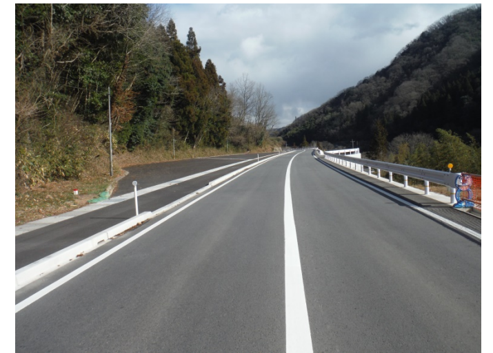
【道路改良】国道375号(日下～引宇根工区) 令和元年度工事 完成部