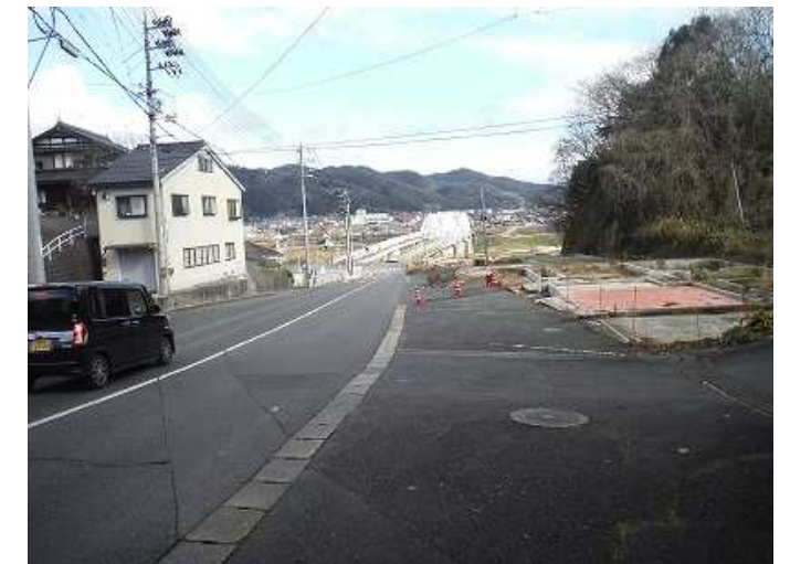
【道路改良】三次江津線(三次町～粟屋町工区) 令和元年度 用地買収