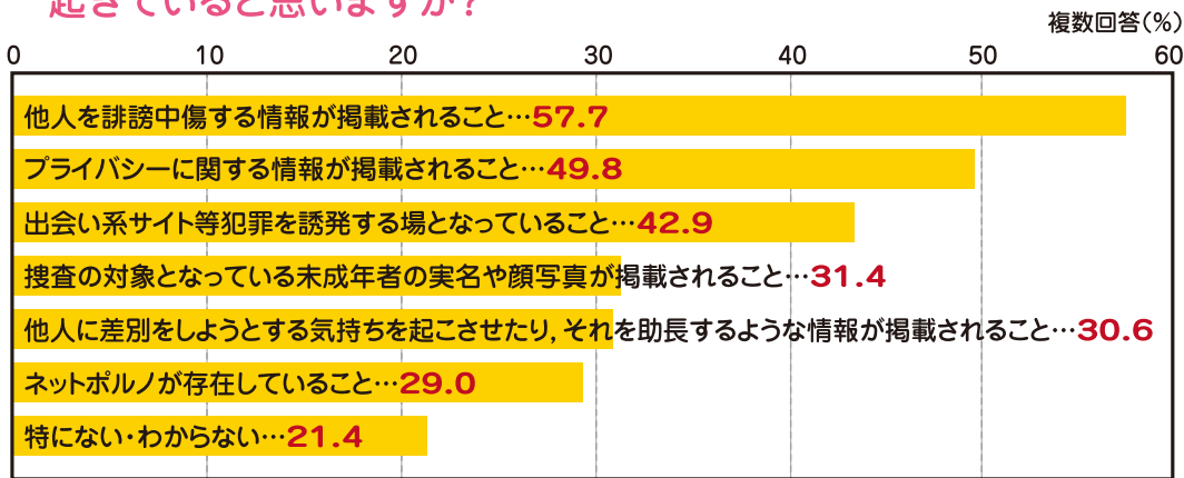
資料：内閣府「人権擁護に関する世論調査」(平成24(2012)年)

●インターネットによる人権侵害に関し、現在、どのような人権問題が起きていますか？