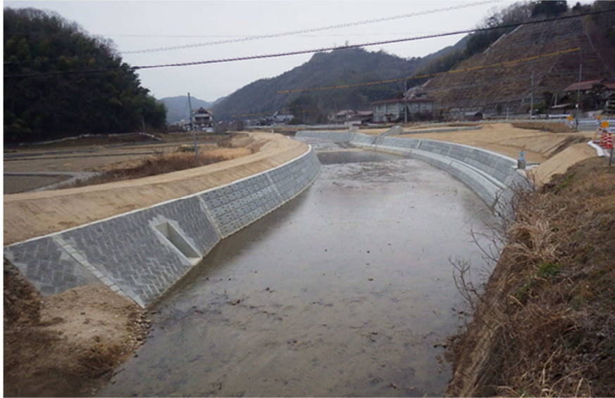
河川改良事業 二級河川沼田川水系 梨和川(三原市)