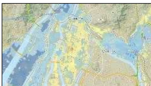
洪水浸水想定区域図

洪水ポータルひろしま : http://www.kouzui.pref.hiroshima.lg.jp/portal/