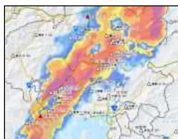
XRAIN (高精度降雨観測情報)