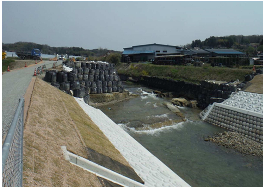
広域河川改修事業 一級河川江の川水系 国兼川(三次市)