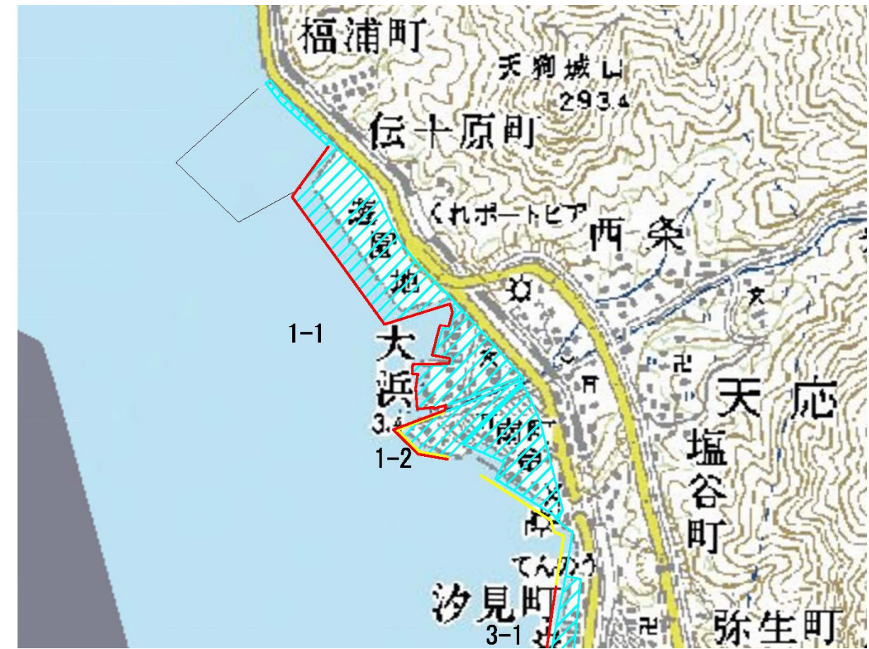
図Ⅱ-2-1(4) 呉・倉橋島・上蒲刈ゾーン