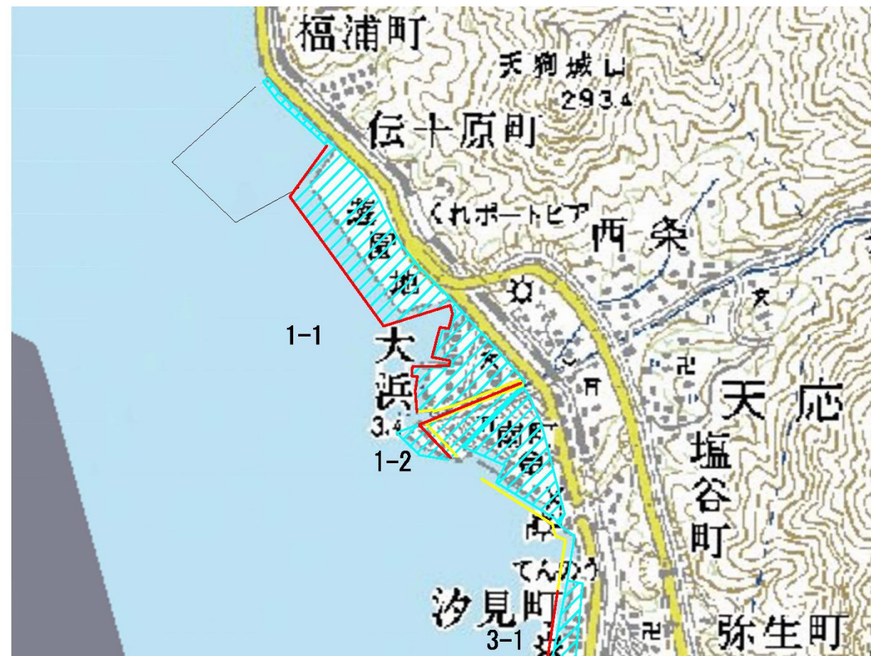
図Ⅱ-2-1(4) 呉・倉橋島・上蒲刈ゾーン