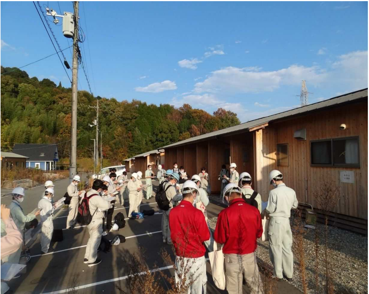
令和2年度被災建築物応急危険度判定実施模擬訓練