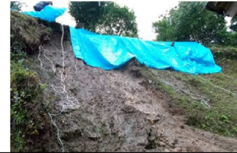
斜面崩壊・被災状況（令和2年7月）