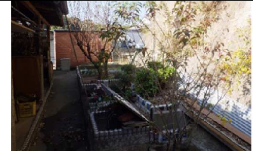
斜面崩壊・被災状況(令和2年7月)