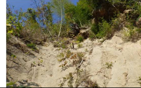
斜面崩壊・被災状況(令和2年7月)

保全対象：人家2戸 主な対策：法枠工 132㎡（地がけ事業） 事業費：約26,200千円（地がけ事業）