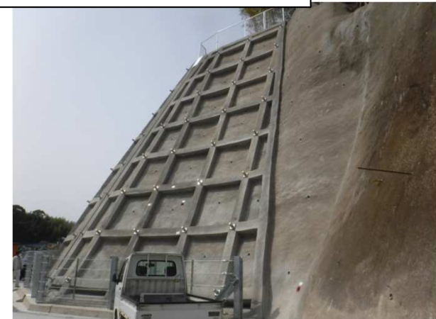
工事完了(令和4年3月30日)