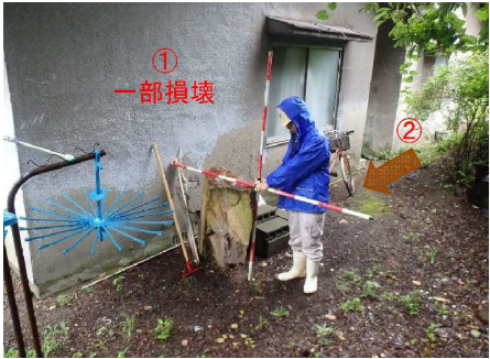
斜面崩壊・被災状況（R2年7月）