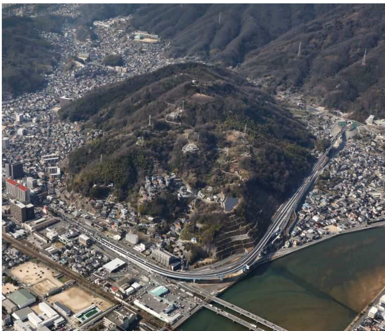
一般国道375号 東広島呉自動車道 阿賀IC立体化（呉市）