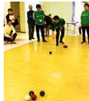
(例)当社職員による大会運営協力やボランティア参加の様子