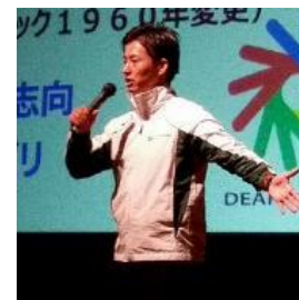
(例)体験会・講演会の様子