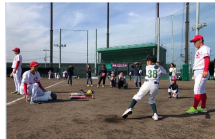
野球部による 野球教室