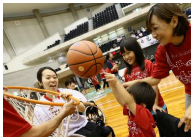
車いすバスケットボール体験会