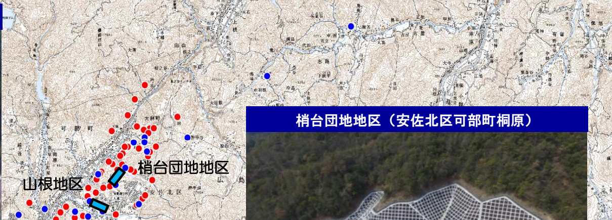
梢台団地地区 (安佐北区可部町桐原)