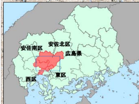
山根地区 (安佐北区可部町桐原)