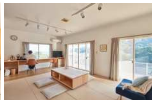
宮崎県日南市 移住促進事業