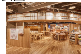
まちの保健室(全景)