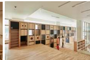
子育て支援施設「Coしがや」