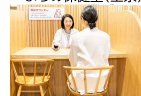
専門家による健康相談