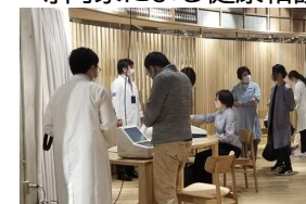
健康測定イベント