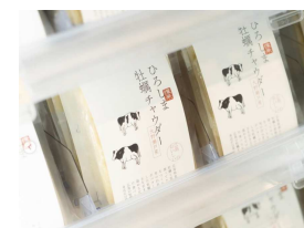
ひろしま牡蠣チャウダー