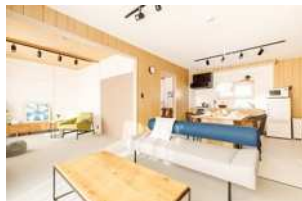
北海道清水町 移住促進事業

■その他住宅のリフォーム・リノベーション、まちづくり基本構想策定、子育て・高齢者施設などの福祉拠点のデザイン、地場産業と連携し、地域木材を用いた家具・什器の開発、販売など。