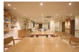
高齢者向け住宅のリノベーション