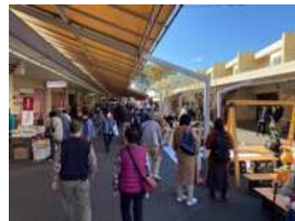
千葉県千葉市 花見川団地の活性化(マルシェ・ワークショップ)