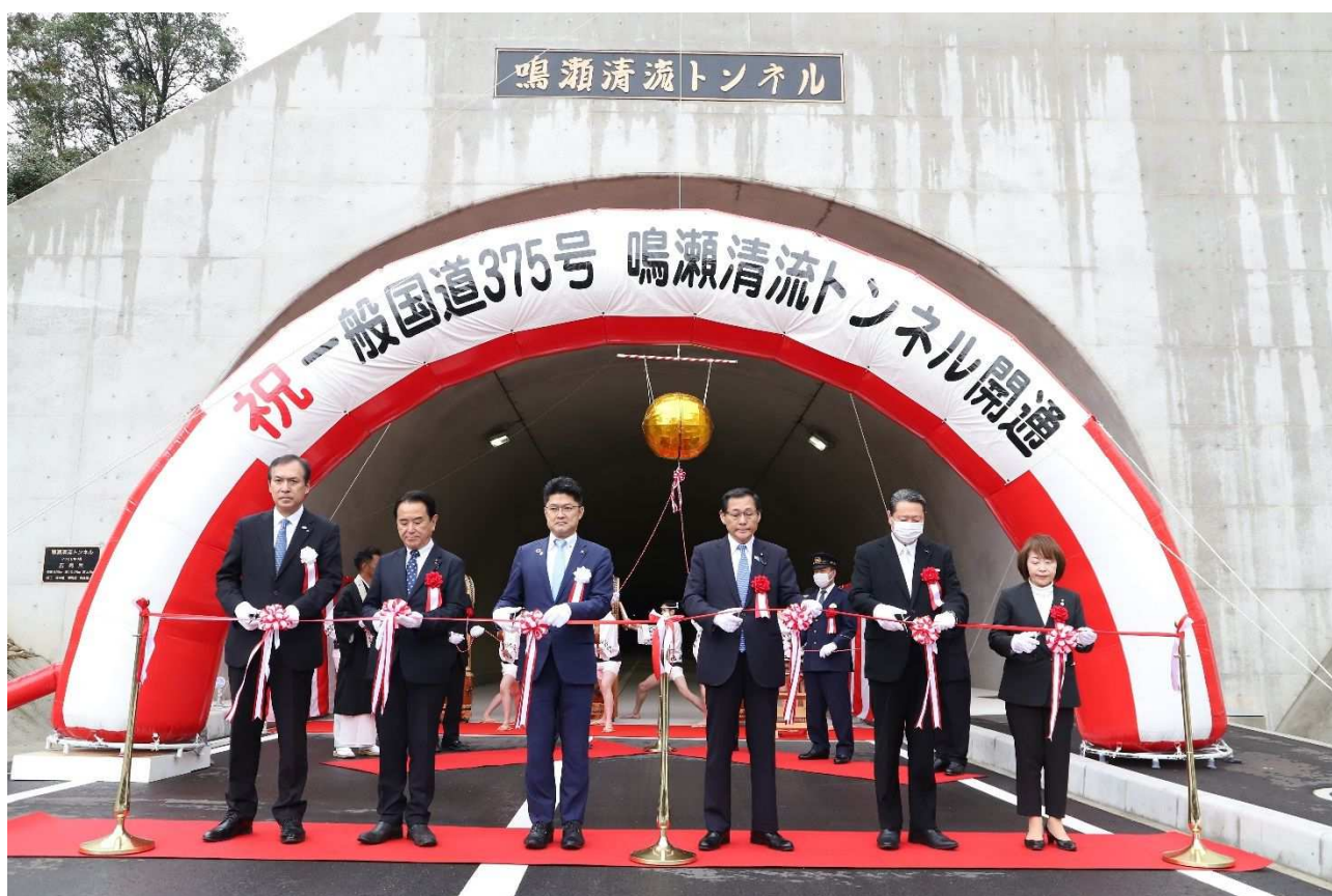
一般国道375号 鳴瀬清流トンネル 供用開始