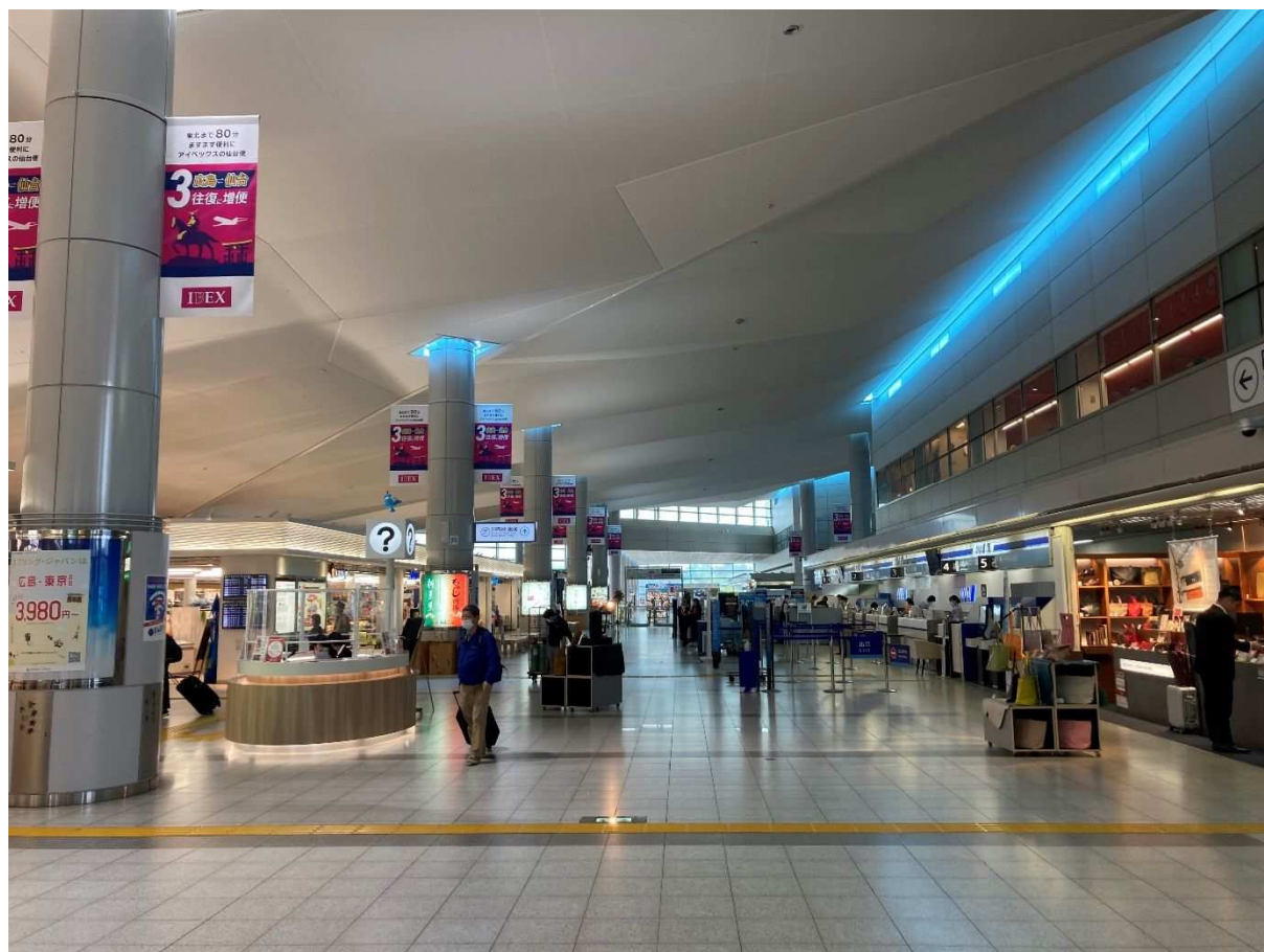
リニューアルした広島空港ターミナルビル