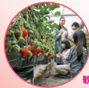
観光農園 (三次市など)