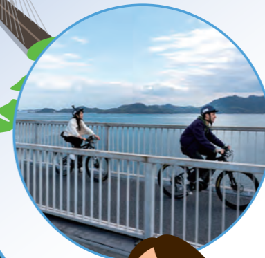
しまなみ海道 サイクリング (尾道市)