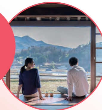
古民家ステイ (庄原市)