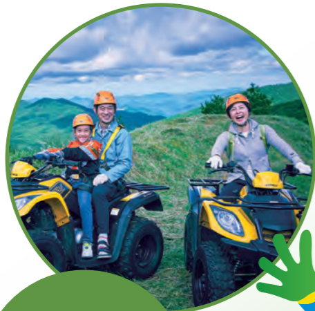
スキー場バギー (北広島町)