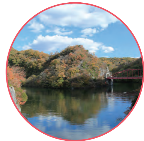
帝釈峡 (庄原市/神石高原町)