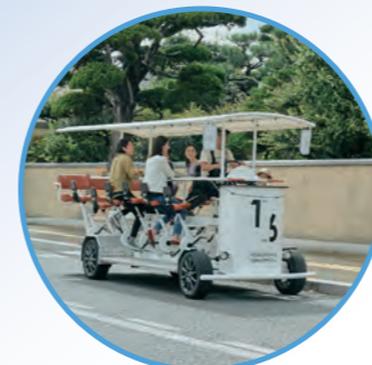
16人乗り自転車 (尾道市)