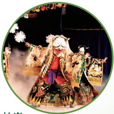
神楽 (芸北エリアなど)