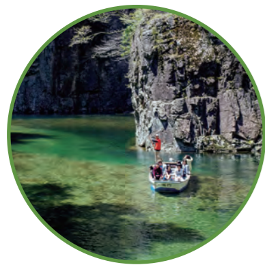
三段峡 (安芸太田町/北広島町)