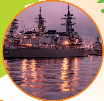
夕呉クルーズ (呉市)