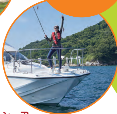
オフショア フィッシング (広島市など)