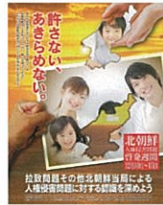
平成25年度 北朝鮮人権侵害問題 啓発週間ポスター