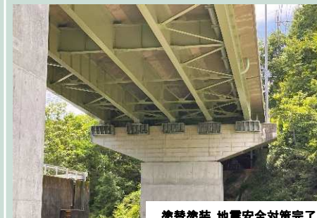
塗替塗装,地震安全対策完了