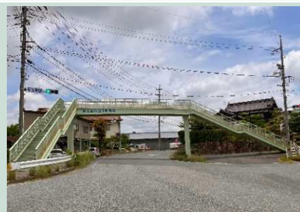
貝石谷橋 (庄原市宮内町)