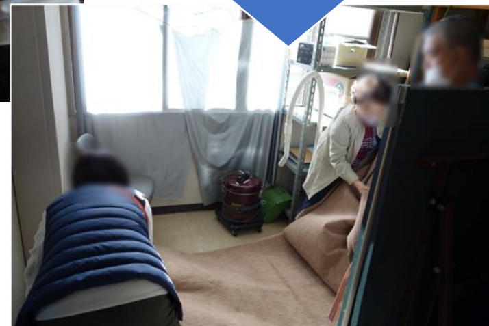
相談への対応の様子 (寝床の設置) (中通地域交流センター)