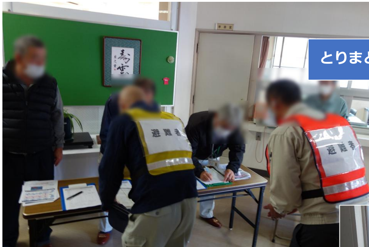
受付での避難者の相談対応の様子 (中通地域交流センター)