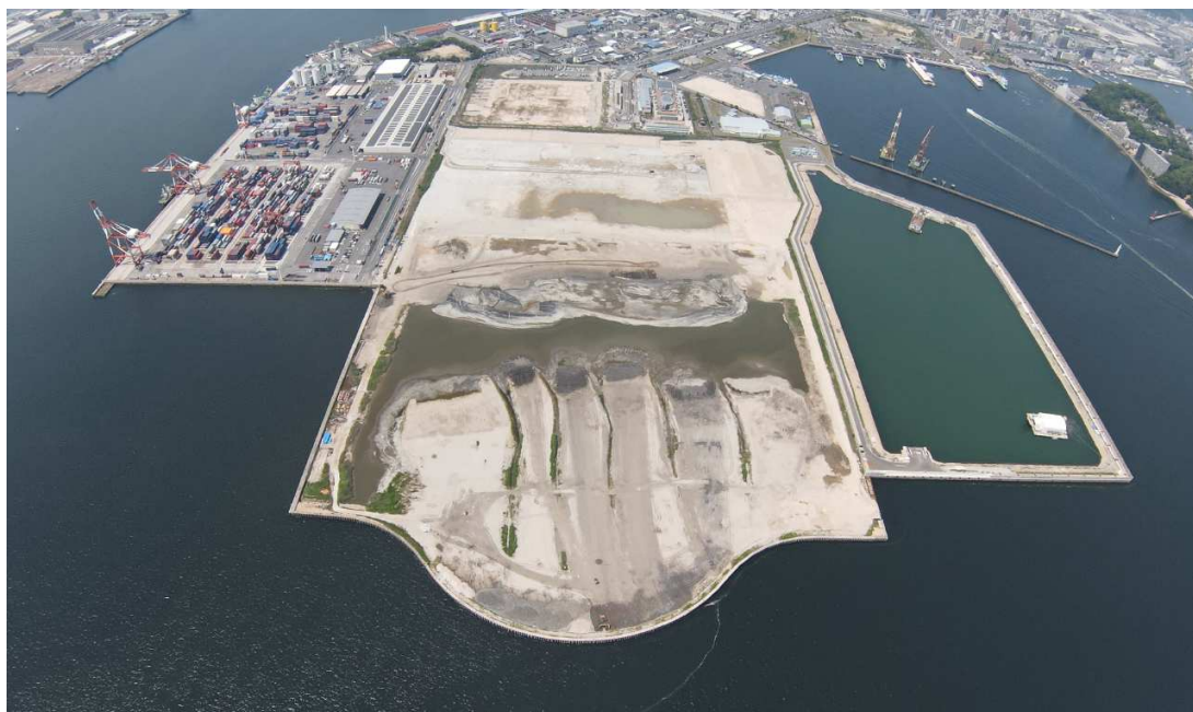
出島地区港湾整備事業〔航空写真(令和3年6月撮影)〕