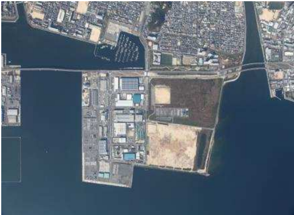
五日市地区港湾整備事業〔航空写真(平成29年12月撮影)〕