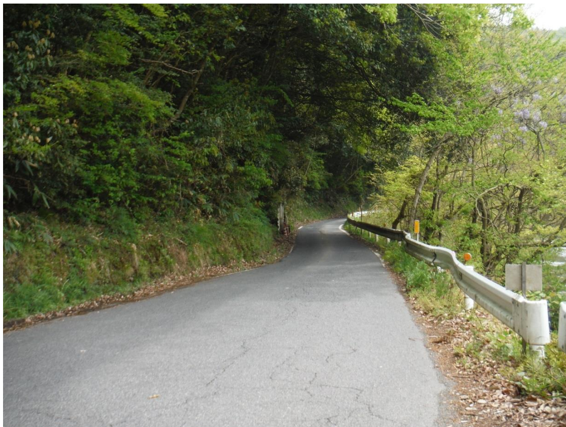
一般国道 375号 三次市日下町