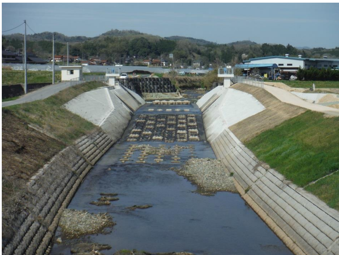
一級河川江の川水系 国兼川 三次市和知町