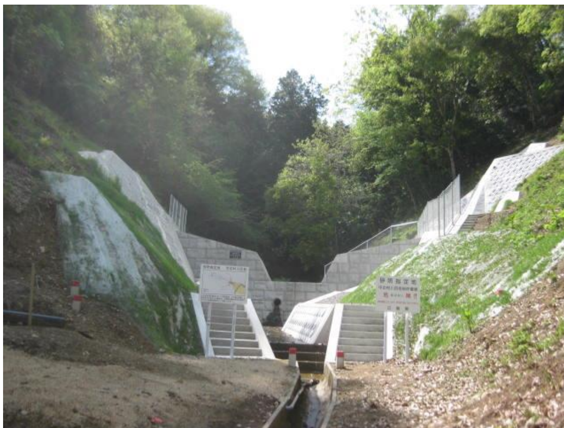
砂防指定地内河川 中の村川4号 三次市粟屋町中ノ村