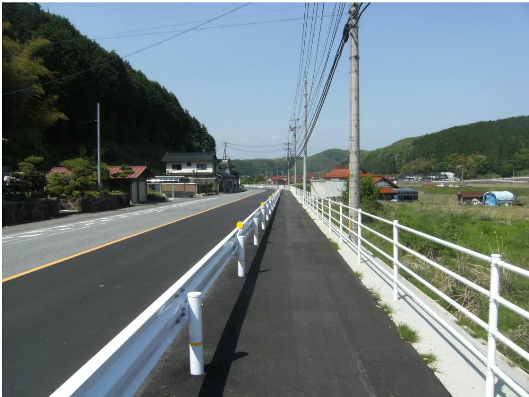
主要地方道 三次高野線 三次市小文町