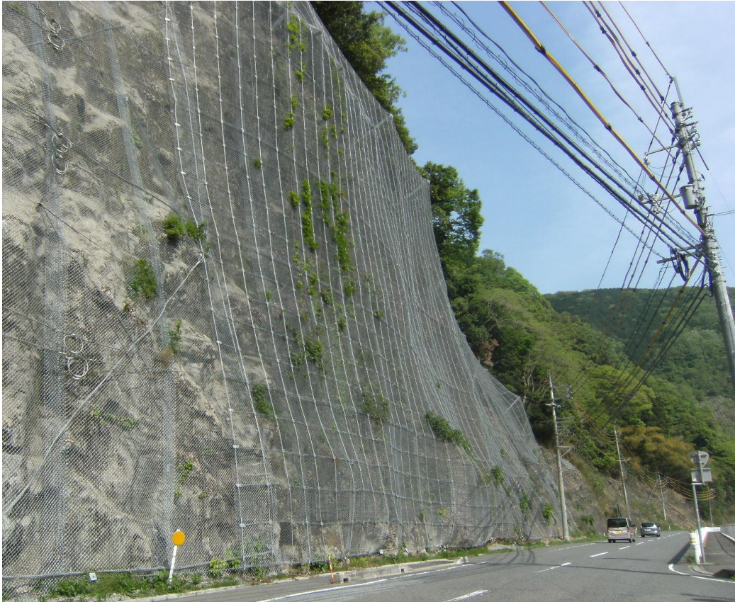
一般国道375号 作木町芝坂 法面防災工事

山地部の多い管内の実態から特に道路交通の安全確保を図るため、落石等危険箇所の総点検を行い、緊急度の高い所から整備を行っており、今年度は、一般国道375号芝坂等の工事を実施する。