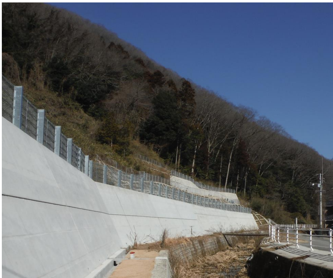
三次市畠敷町 畠敷地区