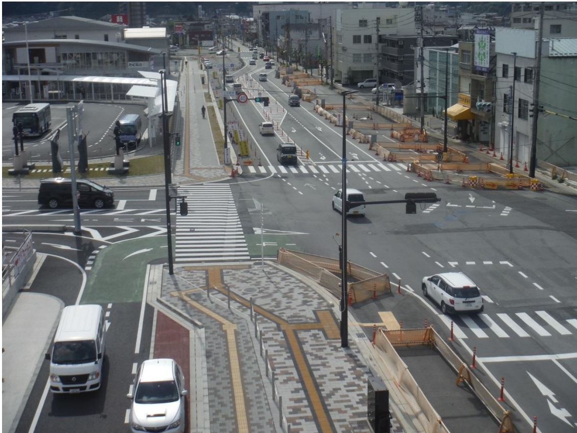
一般国道 183号 三次市十日市中～十日市東