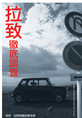
資料：政府 拉致問題対策本部ポスター