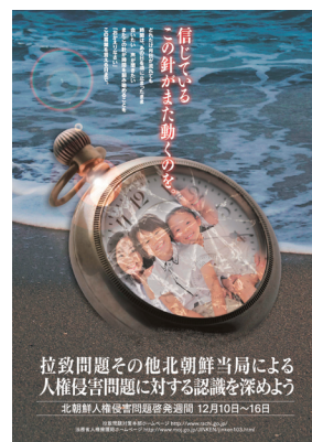
〔平成23年度北朝鮮人権侵害問題啓発週間ポスター〕

内閣官房 拉致問題対策本部ホームページ http://www.rachi.go.jp/