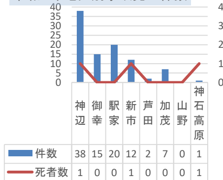
令和6年地区別事故発生件数