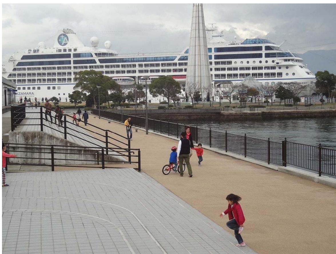
港湾海岸保全施設整備事業 広島港宇品地区（広島市）