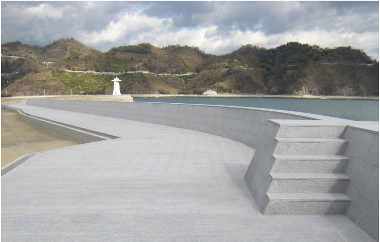
港湾海岸保全施設整備事業 御手洗港蛭子地区（呉市）